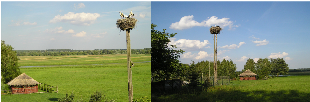
Fotografia Nr 3 i 4 Natura 2000

Fragment Sieci Natura 2000 w miejscowości Sieluń przedstawiają fotografie Nr 3 i 4