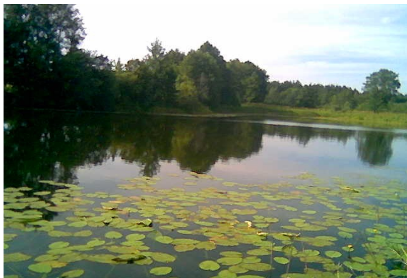
Fotografia nr 5. Jezioro w miejscowości Sieluń