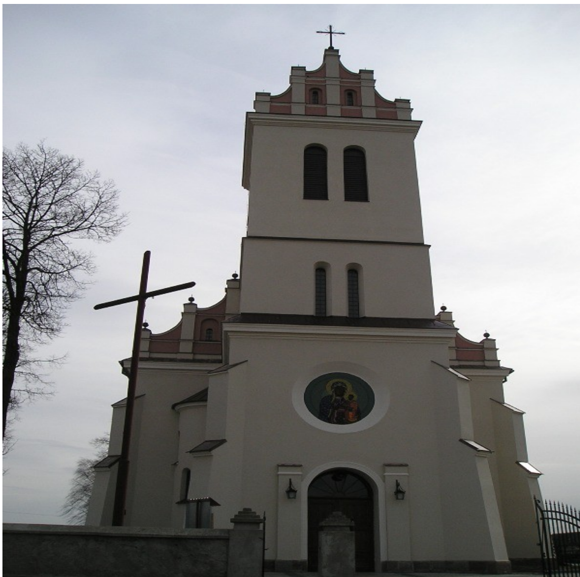
Fotografia Nr 1: Kościół we wsi Sieluń