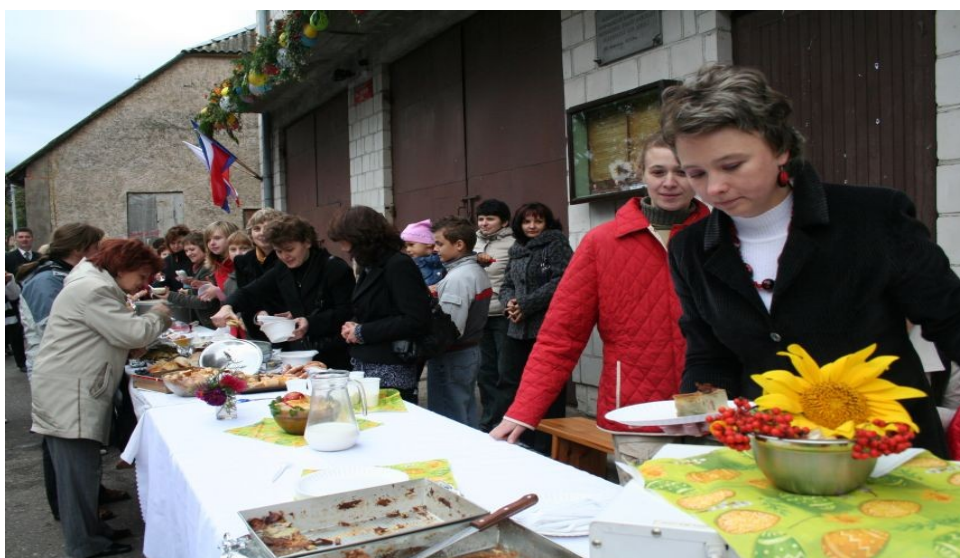
Fotografia nr 2 Stoisko kulinarne na festynie „ Pożegnanie Lata”

Stoisko kulinarne w ramach festynu „Pożegnanie Lata” przedstawia fotografia nr 2