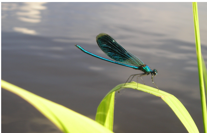
Fotografia Nr 2 Dzika Przyroda w Sieluniu

Różnorodny krajobraz jest rajem dla zwierząt. Żyją: jelenie, dziki, lisy, tchórze. W rzekach, poza rybami (szczupakami, płociami, leszczami), spotkać można bobry, piżmaki. Tereny podmokłe zamieszkuje ptactwo wodne i błotne, wśród nich: łabędzie, żurawie i bociany. Na łąkach i polach żyje wiele gatunków ptaków śpiewających.