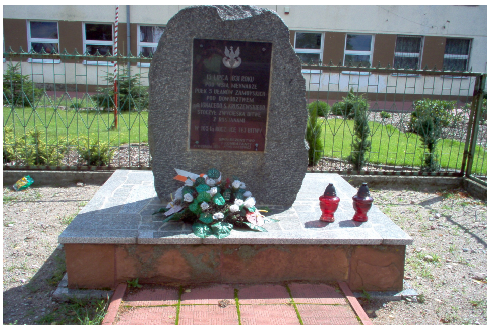
Fotografia nr 1. Pomnik upamiętniający bitwę pod Młynarzami w 1831 roku.

W miejscowości Młynarze nie ma zabytków, jedynie na terenie Szkoły Podstawowej w Młynarzach znajduje się pomnik upamiętniający bitwę z roku 1831 z Moskalami wybudowany w 1996 roku. Podlega on ochronie konserwatorskiej, ale nie jest on objęty ochroną prawną. Pomnik ten przedstawia fotografia nr 1